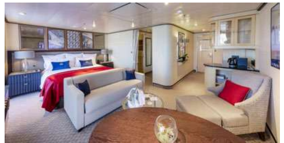
Suite Queens Grill balcon, cat.Q5