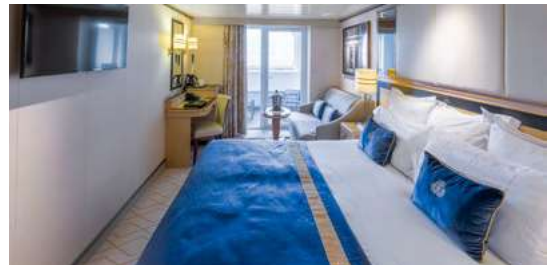
Cabine extérieure balcon

**le crédit à bord est non applicable sur les tarifs promotionnels