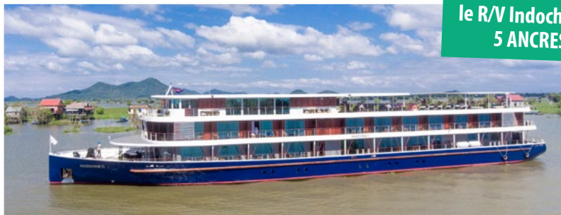
le R/V Indochine II 5 ANCRES