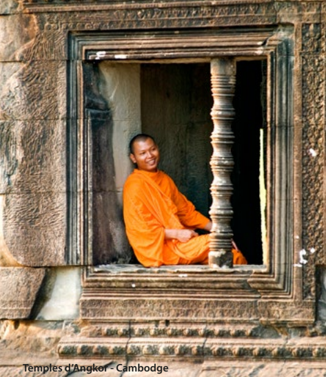
Temples d'Angkor - Cambodge

Que vous ayez soif de culture, envie de relaxation ou désir de rencontre, ce voyage aux confins du Vietnam et du Cambodge vous fera découvrir de véritables «petits paradis entre ciel et eau» au fil du fleuve Mékong. La magie des temples et des pagodes vous attend ainsi que les us et coutumes de ces peuples généreux et accueillants, sans parler des mille et une saveurs qui flatteront votre palais. Laissez-vous guider, ce voyage inoubliable saura vous combler !