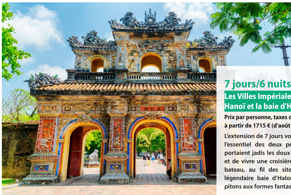
Huế - Vietnam