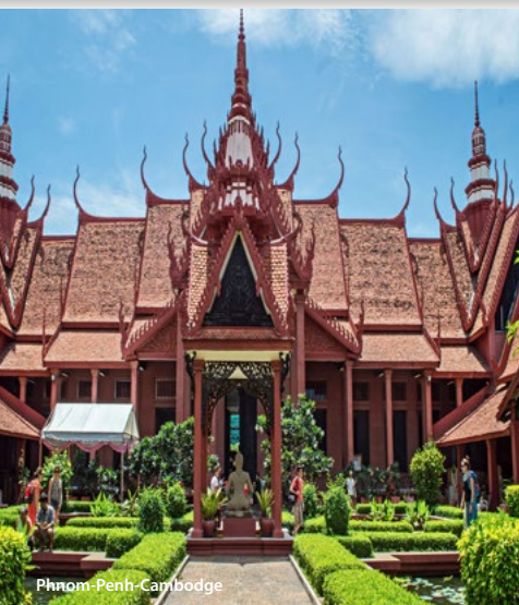
Phnom-Penh - Cambodge