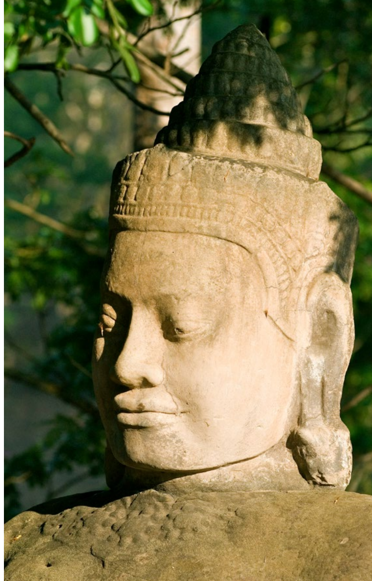
Temples d'Angkor - Cambodge

N.B. : L'itinéraire, les escales ou les visites pourront être modifiés par l'armateur et nos représentants sur place. Les excursions pourront être modifiées ou inversées en cas de nécessité. Le commandant est seul juge pour modifier l'itinéraire du bateau pour des raisons de sécurité et de navigation. *Traversée du lac Tonlé : en période de hautes eaux, en principe d'août à fin novembre, la traversée s'effectue avec le bateau RV Indochine (ou II). En période de basses eaux, de décembre à février, la traversée du lac se fait en bateaux rapides pour rejoindre le RV Indochine (ou RV Indochine II) à Koh Chau. Enfin, en période de très basses eaux, aux environs de février à avril, le transfert de Siem Reap à Koh Chen où se trouve le bateau s'effectue en autocar climatisé / L'abus d'alcool est dangereux pour la santé, à consommer avec modération.