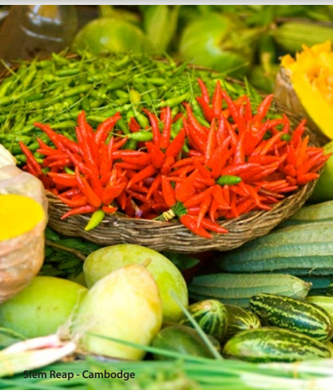
Siem Reap - Cambodge