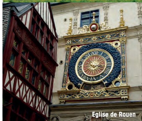
Eglise de Rouen