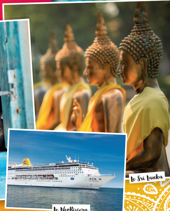
Le Sri Lanka