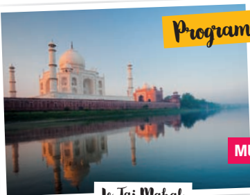
Le Taj Mahal