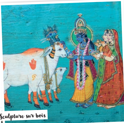
Sculpture sur bois