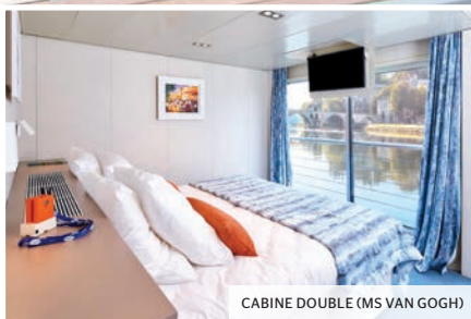
CABINE DOUBLE (MS VAN GOGH)