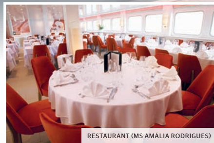
RESTAURANT (MS AMÁLIA RODRIGUES)