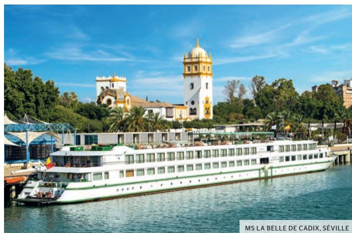
MS LA BELLE DE CADIX, SÉVILLE

Débarquement. Transfert (1) et vol (1) vers Paris.