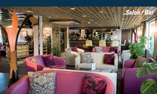
Salon / Bar

Situé au niveau du pont intermédiaire, le restaurant est l'endroit où tous vos repas sont servis pendant la croisière. Grâce à ses grandes fenêtres panoramiques, vous ne manquerez pas les beaux paysages qui défilent pendant vos repas.