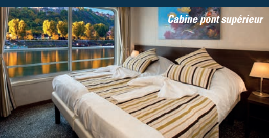
Cabine pont supérieur

Il peut accueillir 176 passagers, dans 88 cabines disposées sur trois ponts.