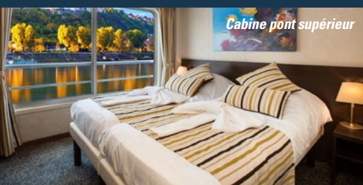
Cabine pont supérieur

Il peut accueillir 176 passagers, dans 88 cabines disposées sur trois ponts.