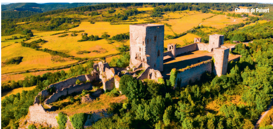
Château de Puivert