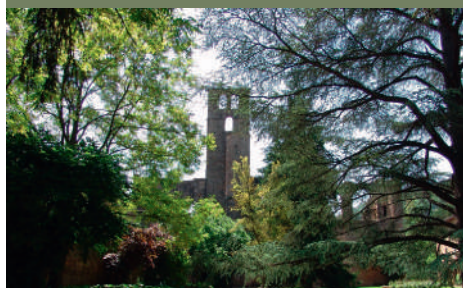
Les deux bâtiments donnent sur un parc arboré de 10ha.

L'établissement se compose de 2 bâtiments de 10 chambres chacun : l'Orangerie et l'ancien Evêché.