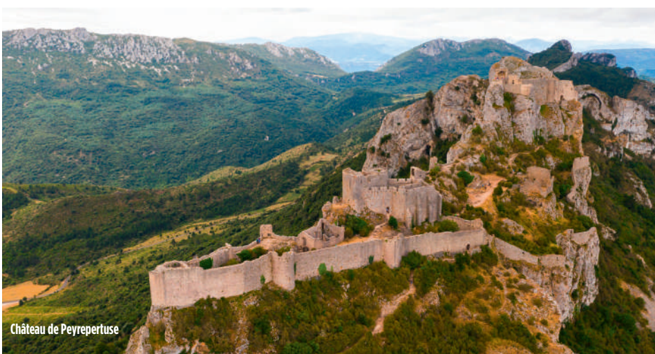
Château de Peyrepertuse