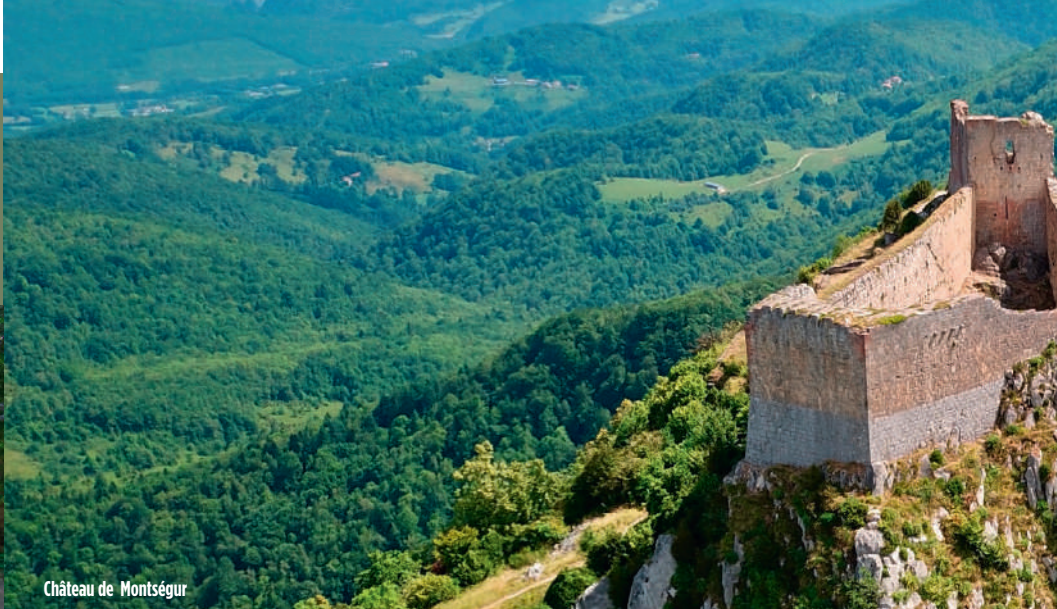
Château de Montségur

Retrouvez tous nos circuits, séjours et croisières sur le site : www.voyages-lecteurs.fr