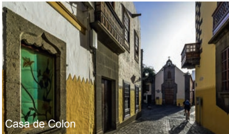
Casa de Colon

village abrite en sa basilique la statue de la sainte patronne de l'île, Notre Dame du Pin. Continuation vers Arucas , capitale des bananes et des fleurs. Vous pourrez y admirer son imposante cathédrale noire (extérieurs) et finirez par une visite des jardins de la marquise d'Arucas. Vous pourrez y admirer près de 400 espèces de plantes tropicales et subtropicales. Navigation vers Fuerteventura. Pour cette dernière traversée dans l'archipel des Canaries, vous sesur le pont soleil pour partager un apéritif. Soirée de gala.