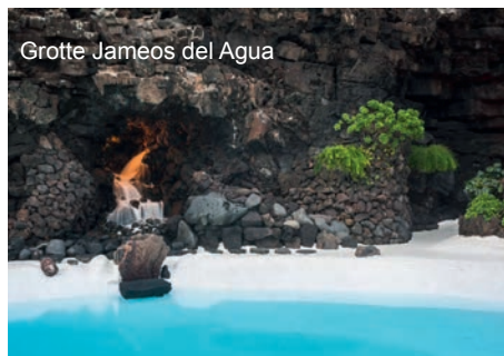
Grotte Jameos del Agua

Lanzarote est la plus originale des îles Canaries avec ses fascinants paysages de laves noires constellés d'oasis de verdure et de cultures, caressés par des eaux d'un bleu intense. Matinée consacrée à l' excursion facultative au Parc national de Timanfaya . A Janubio , vous admirerez un cratère de saline dont le lagon naturel reçoit son eau de la mer. Vous rejoindrez l'une des plus anciennes bodegas de l'île pour une dégustation de vins et fromages canariens. La roche volcanique donne à chacun de ses vins un beau contraste de couleurs et une grande variété de nuances. Il en est de même pour ses fromages élaborés à partir de lait de chèvre. L'après-midi , excursion facultative sur les traces de César Manrique , l'artiste le plus important des Canaries. Connu en tant que peintre, architecte, constructeur et sculpteur, il était aussi un écologiste qui abhorrait tous les signes de la construction moderne. Vous découvrirez la grotte Jameos del Agua , le résultat fascinant de l'activité volcanique combiné avec le talent architectural de César Manrique. Puis vous rejoindrez le mirador del Rio , au nord de l'île, une œuvre d'art perchée au sommet d'une imposante falaise. Enfin, vous visiterez la maison de César Manrique , véritable incarnation de son talent. La maison de César Manrique est à moitié submergée dans des bulles volcaniques peintes en blanc et noir. Pour cette dernière soirée à bord, rejoignez le salon bar pour assister à un spectacle folklorique .