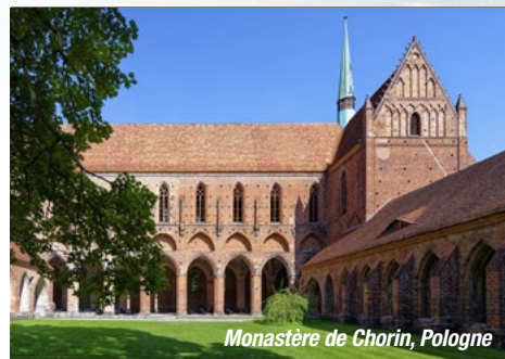
Monastère de Chorin, Pologne

Son impressionnante bâtisse se dévoile dans un cadre paysagé au cœur de la réserve de la biosphère de Schorfheide-Chorin. Construit en 127, ce monastère est l'un des plus importants bâtiments historiques de l'ancienne architecture gothique de brique. Ses formes et ses ornements rappellent les grandes cathédrales de Cologne, Paris et Sienna. Retour à bord à Mescherin et poursuite de la navigation vers Szczecin. Arrivée en soirée. Soirée animée. Escala de nuit.