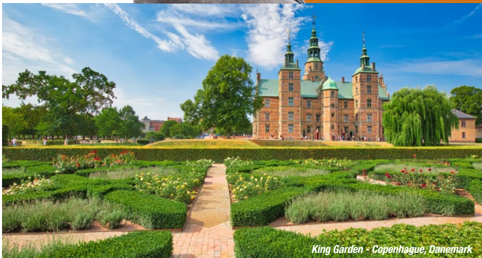
King Garden - Copenhague, Danemark

Débarquement et transfert en autocar vers Rostock. Embarquement à bord du ferry pour Gedser (durée 2h). Déjeuner libre. Transfert en autocar vers Copenhague, sans aucun doute la plus cosmopolite et la plus accessible de toutes les capitales scandinaves. La « cité royale » est un havre de paix, de culture et de convivialité. Outre les nombreux musées et galeries d'art, elle arbore des monuments uniques ainsi que d'innombrables rues anciennes et de charmants quartiers où il fait bon flâner. Vous vous installerez dans votre hôtel 4* NL. Dîner et nuit à l'hôtel.