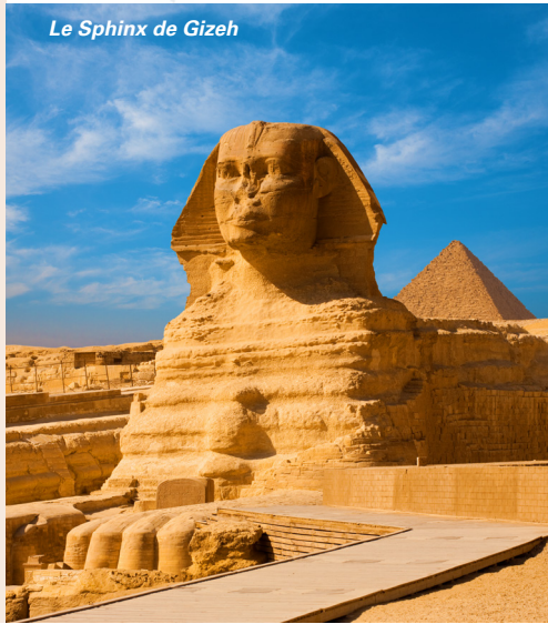
Le Sphinx de Gizeh