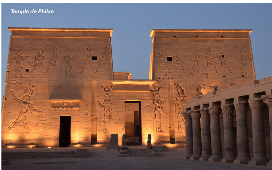
Temple de Philae

Visite incluse de la Vallée des Rois et de 4 de ses tombeaux , dont celui de Séti 1 er le plus grand et mieux conservé des 64 tombeaux de la vallée des rois. Les riches décors des tombes illustrent les aventureuses étapes du voyage vers l'au-delà. Le pharaon défunt devait accompagner Rê le dieu soleil dans sa course nocturne sans qu'aucune puissance infernale ne puisse le détenir et renaître avec l'astre lorsque sa lumière jaillirait à nouveau des ténébres. Arrêt photos aux deux colosses de Memnon . Déjeuner à bord . Visite incluse du site de Louxor , bâti sous le règne d'Aménophis III et de Ramsès II, le temple se dresse majestueusement sur les berges du Nil . Ce