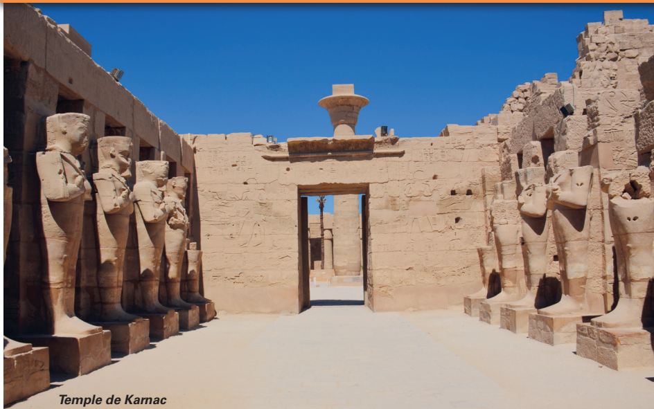
Temple de Kamac